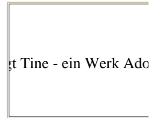
Tine - ein Werk Adolf Brütts

zurück zur Übersicht Husumer Persönlichkeiten